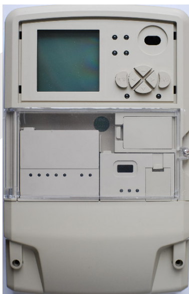
图 1 参考平台外观

飞思卡尔集中器参考设计是根据中国国家电网公司文件-《电力用户用电信息采集系统功能规范》附件 Q/GDW 375.2-2009《电力用户用电信息采集系统型式规范：集中器形式规范》的定义进行的软件及硬件平台设计。用户在第一次拿到参考平台时应遵循本手册步骤来准备并使用该平台。在熟悉平台之后，再参考硬件手册和软件手册进行深入了解。参考平台外观如图 1 所示。